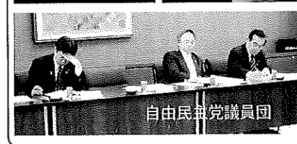
自由民主党議員団