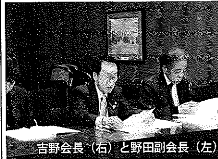
吉野会長(右)と野田副会長(左)